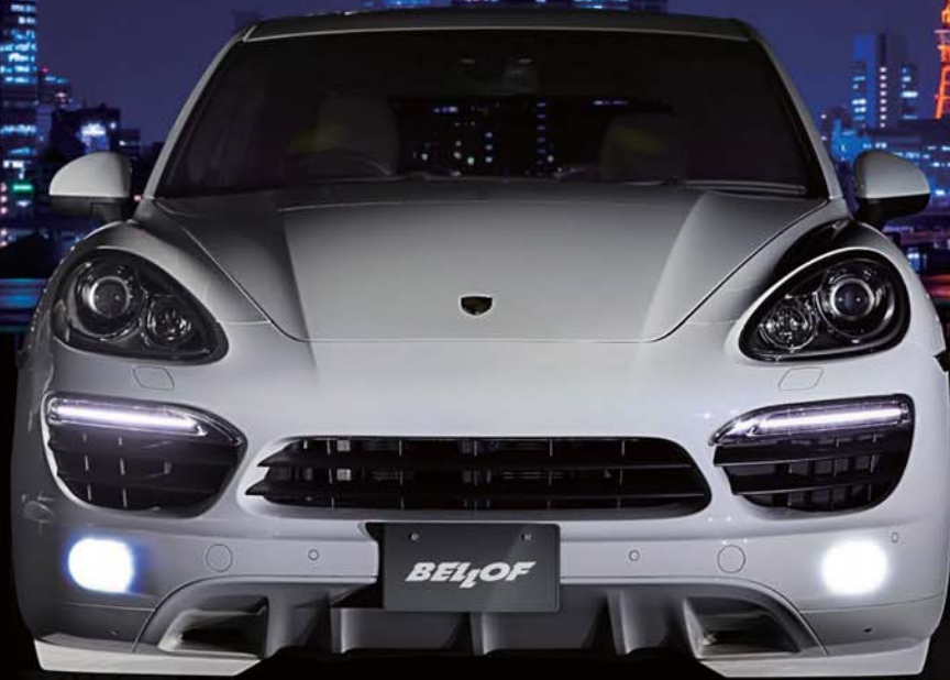
White or Yellow